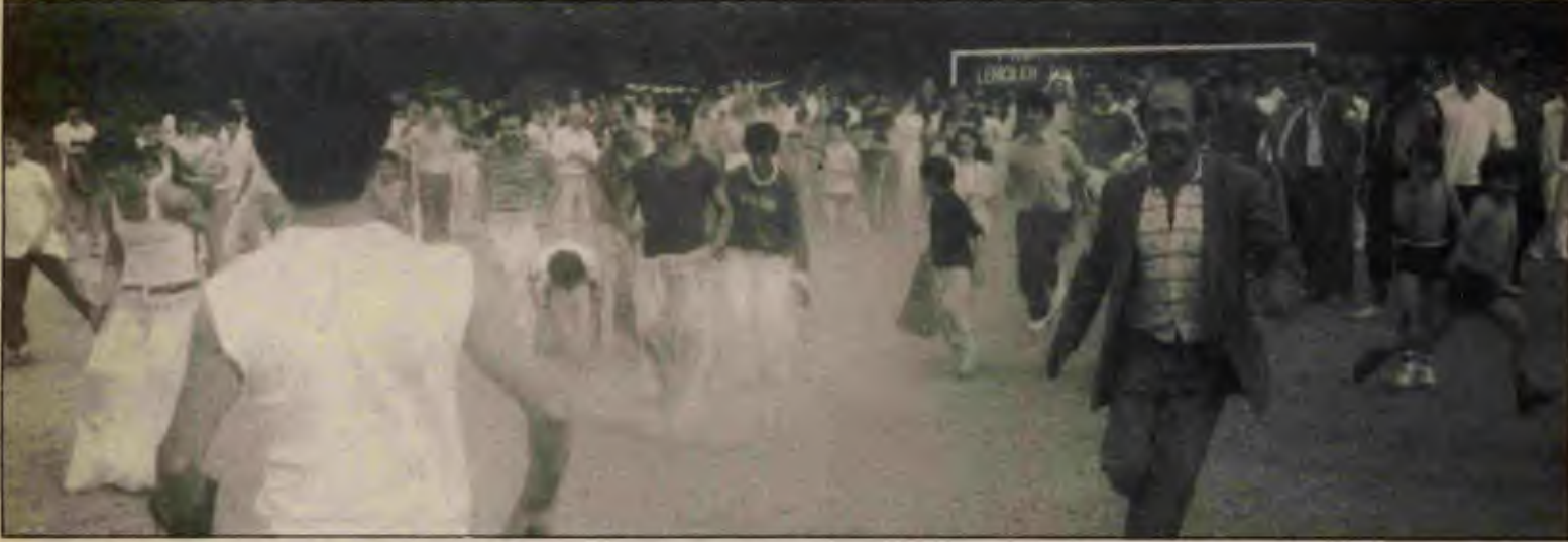
Çuval yarışı herkesi eğlendirdi.