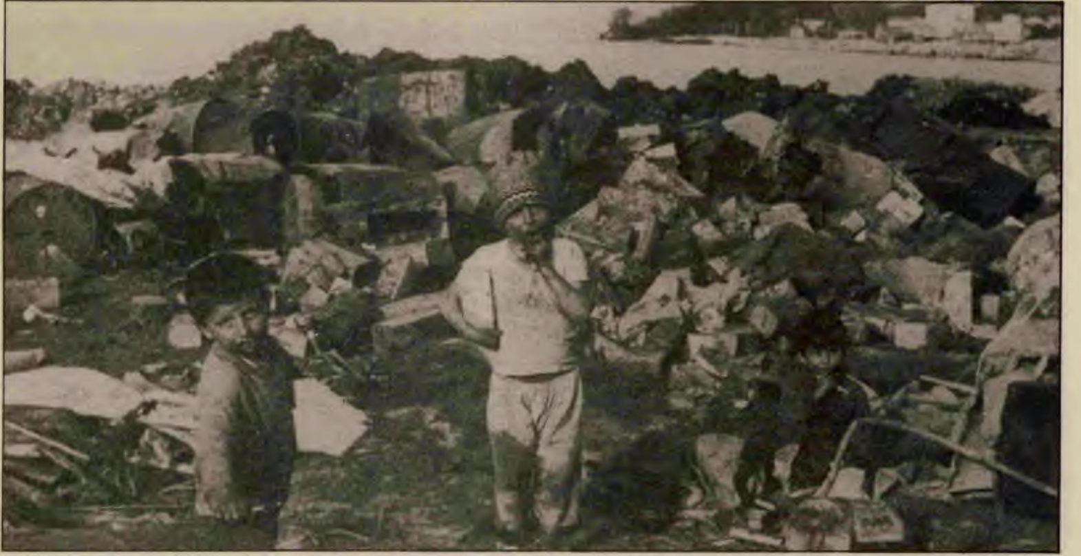
Çöplükler çocuk bahçesi olunca...

zararlılardan korumak adına, canlılara zarar taşımayı canlandırıyor. Kuşları, hayvanları öldüren bu tarım ilaçlarının bölge halkı, bu topraklarda çalışan on binlerce tarım işçisi üzerindeki etkilerine ise değinilmiyor bile. Burjuvazi kısa erimli kâr amaçları peşinde, bir yandan canlıları zehirliyor öte yandan artık birçok ülkede adı bile unutulmuş sıtma gibi illet bir salgını da beraberinde getiriyor.