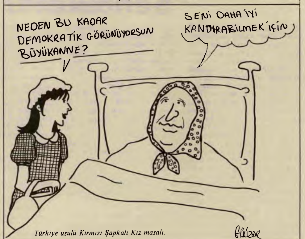
Türkiye usulü Kırmızı Şapkalı Kız masalı.