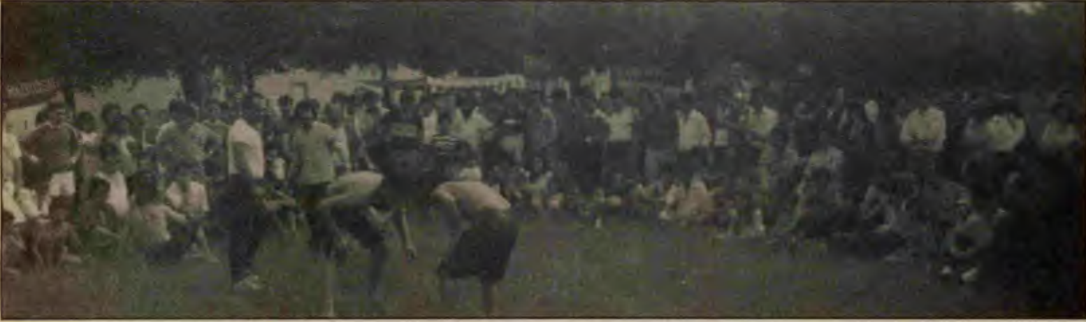
Festivalde yağlı güreşler büyük ilgi topladı.

Paris İşçi Birliği (PİB) 29-30 Haziran günlerinde Gençlik Festivali-85 adıyla bir festival düzenledi. 1500'den fazla kişinin katıldığı festival gerçekten çok başarılı bir festival oldu. Festivalde düzenlenen çeşitli yarışmalara toplam 263 sporcu ve yarışmacı katıldı.