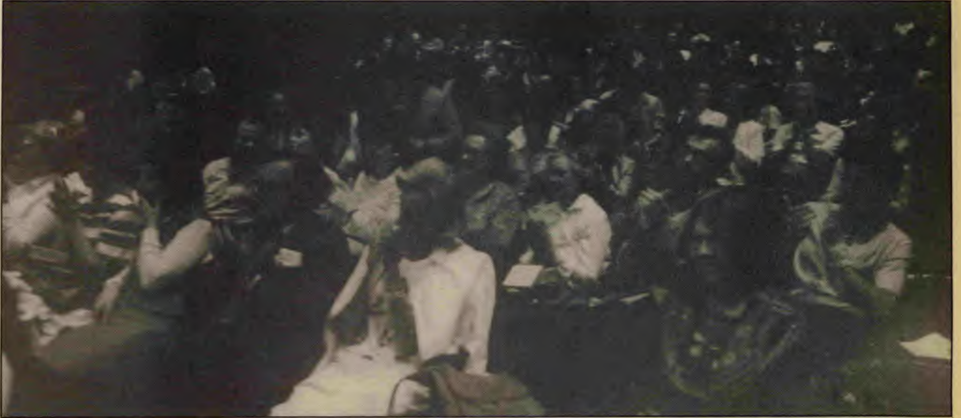
Purcell Room'da büyük bir çoğunluğu İngilizlerin oluşturduğu sanatseverler.

Londra İşçi Birliği (LİB), İngiltere Türkiyeli Kadınlar Birliği (İTKB) ve çalışmalarına yeni başlamış olan Gençlik Merkezi ortaklaşa olarak, 18 Temmuz günü bir Gençlik ve Dostluk Gecesi düzenlediler. Büyük Londra Belediyesi'nin yıl boyunca süren gençlik festivallerinin bir halkasını oluşturan gece, Londra'nın ünlü kültür merkez-