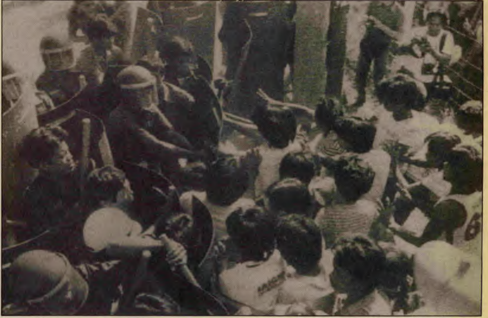
Filipinli işçiler grev bayrağını her türlü baskıya karşı dalgalandırıyor.

Aslında, Marcos, ne Filipinler kapitalizminin ne de ABD'nin Filipinler için bugünkü istemlerine uyan lider tipidir. Marcos'un elleri, oluk gibi akıttığı kanlarla öylesine kirlenmiştir ki, halka pembe "demokrasi" masalları anlatmanın gündeme geldiği bir dönemde, "iyi prens" rolünü üstlenmesi gerçekçi değildir. Filipinler burjuvazisi de, ABD de, "iyi prens" rolünü üstlenebilecek, yükselen devrim hareketini reformizm yayararak kapitalizmin kabul sınırlarına hapsedip boğabilecek bir burjuva muhalefet lideri peşindedir. Ve Marcos da bu gerçeğin farkındadır.