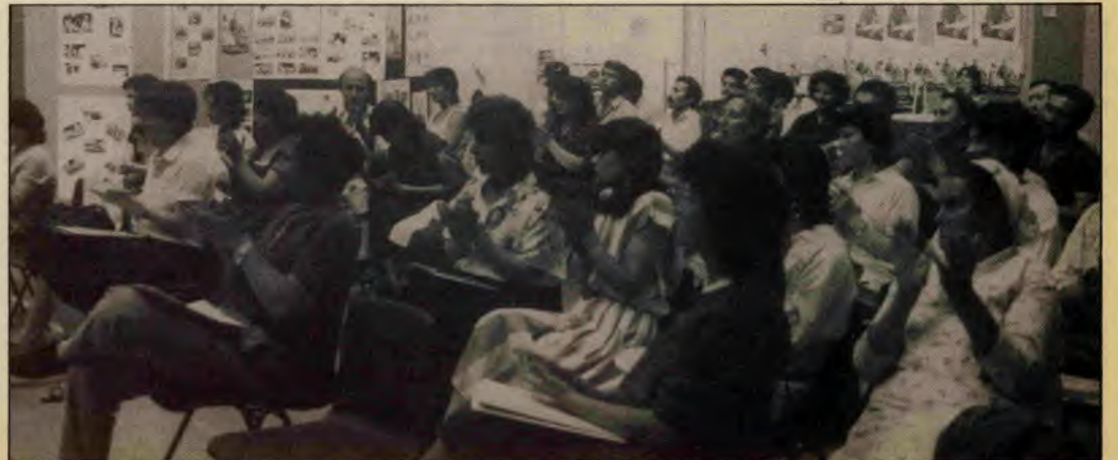
Kongreye, kadınların yanı sıra kadın sorununu "kadınların sorunu" olarak anlamayan çok sayıda erkek dinleyici de katıldı.